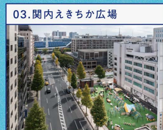
関内外open!13 (関内えきちか広場活用事例)