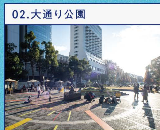
大通り公園によりみちしよう。 (令和3年度大通り公園社会実験)